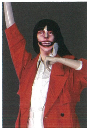
口裂け女(遠野市立博物館蔵)

日本人は自然とともに暮らしてきました。そして、自然災害や説明のつかない現象に遭遇し不安や恐怖にかられたとき、語り伝えられてきた妖怪が引き起こしているのではないかと考えてきました。