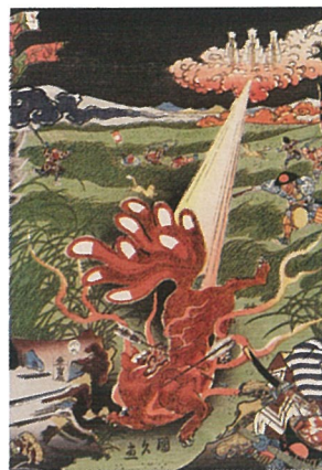
九尾狐退治(福岡市博物館蔵)