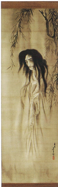
幽霊図 藪田蘆堂(福岡市博物館蔵)