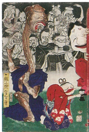
於吹鳥之館直之古狸退治図(福岡市博物館蔵)