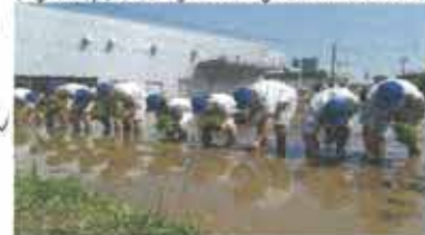
〈学校敷地内の大田学での田植え〉