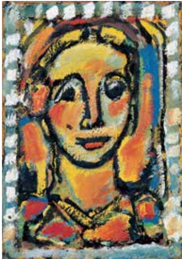
《マドレーヌ》 1956年 パナソニック汐留美術館蔵