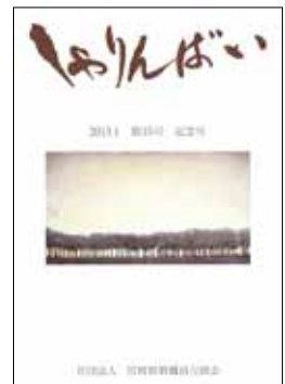
「しゃりんばい」 第35号

投稿を希望する方には、募集要項・応募用紙をお送りしますので教職員互助会（0985-29-1242）までご連絡ください。