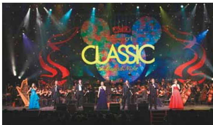
ステージ写真は過去の公演です