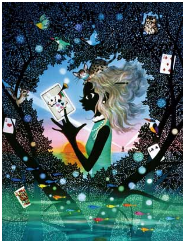
『アリスのハート』2005年 ©Seiji Fujishiro/Hori Pro

2013年 6月29日 土 ▶ 9月1日 日 会期中 無休 開館時間：10:00～18:00（入室は17:30まで）