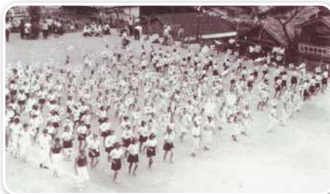
昭和 32年 運動会