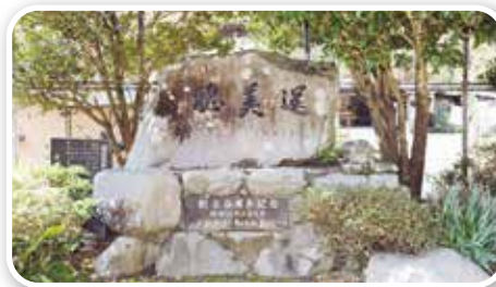
昭和 56年 創立百周年記念 ▶

「赤い屋根の学校」と呼ばれて親しまれた中之又小学校は、明治5年の創立以来136年の歴史に終止符を打った。