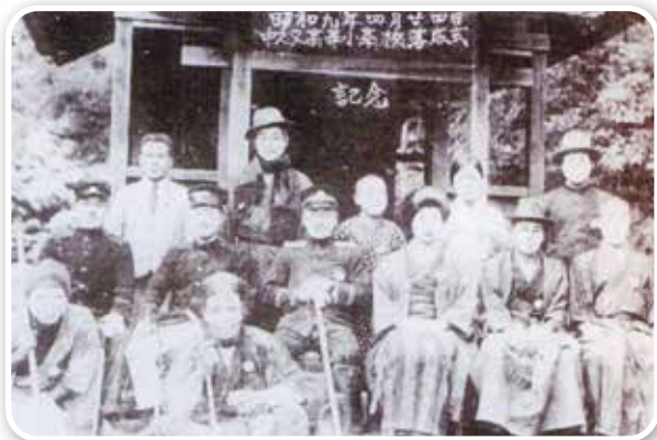
昭和 9年 中之又高等小学校 落成式