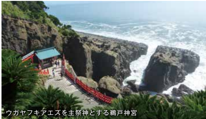
ウガヤフキアエズを主祭神とする鶴戸神宮