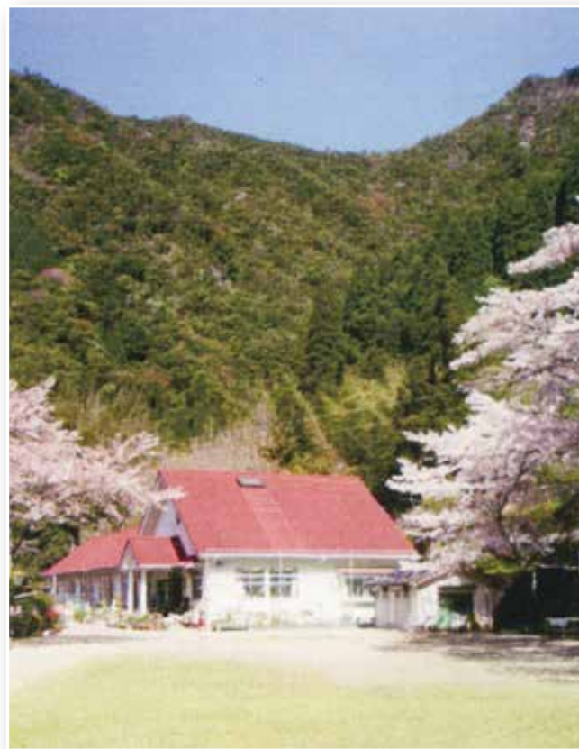
春爛漫 赤い屋根の学校 ▶

このシリーズで掲載する記事は、「ここに学校があった 第二編—平成の統合・閉校の記録」出版のため収集した資料をもとに編集しています。