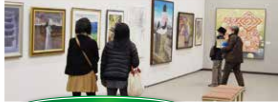
展示会場及び展示期間