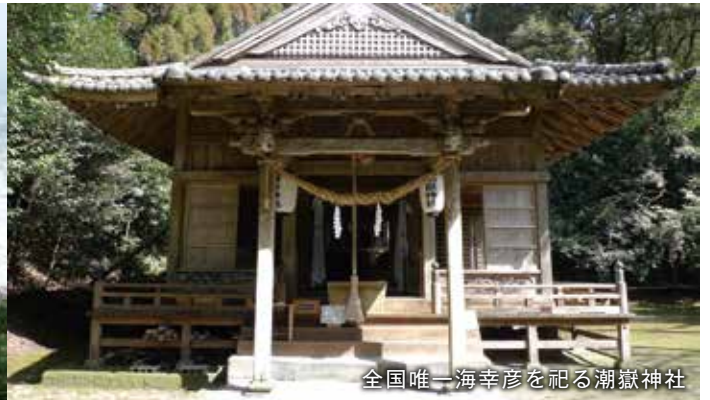
全国唯一海幸彦を祀る潮嶽神社