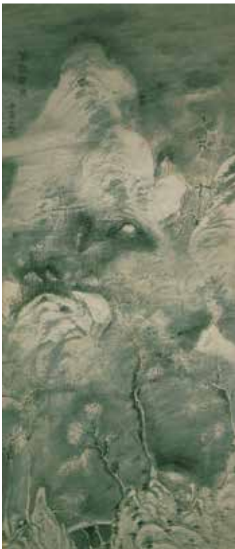
国宝 浦上玉堂「凍雲篩雪図」 川端康成記念会蔵