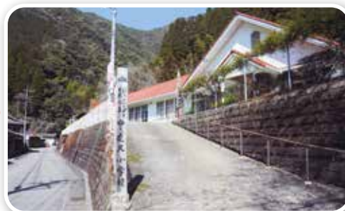
現在はコミュニティ施設として活用されている