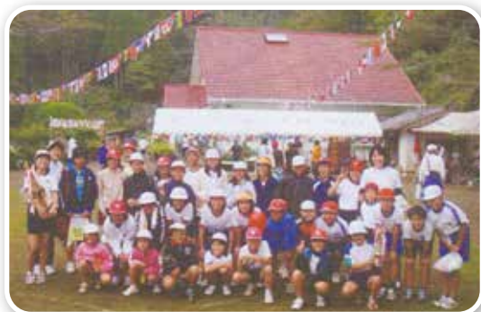
平成 20年 最後の運動会