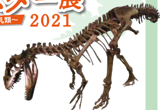
所蔵 天草市立御所浦白亜紀資料館

太古の時代をいっしょに歩んできた「恐竜」と「ほ乳類」たちの、出現から進化、繁栄そして絶滅をくりかえした歴史を、200点を超える展示資料で紐解きます。さまざまな姿の絶滅モンスターから、たくさんの命をはぐくむ地球のすばらしさと、さまざまな生物で守られてきた地球の環境の大切さに気づくことができるでしょう。