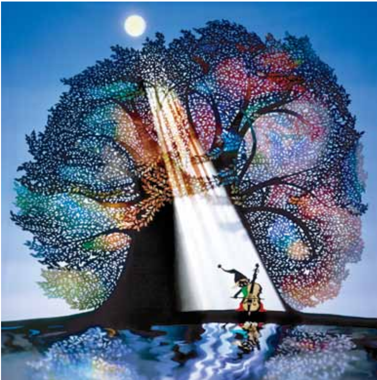
『月光の響』1981年 ©Seiji Fujishiro/Hori Pro