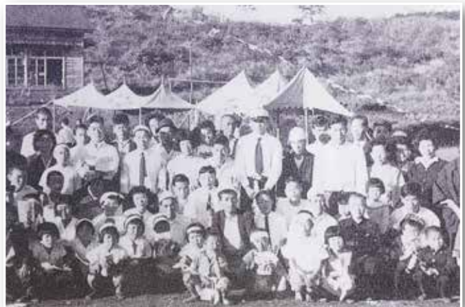
創立3年目（昭和31年）にぎわった運動会

昭和29年の開校時には26人であった児童数も翌年38人、昭和31年45人、昭和35年には54人と増加していき、3学級に学級が増加し、先生も4人になった。ところが、この54人をピークに児童数は減り始め、昭和45年には20人台となった。平成になってからも減り続け、平成15年5人、平成16年3人となり、ついに休校となった。