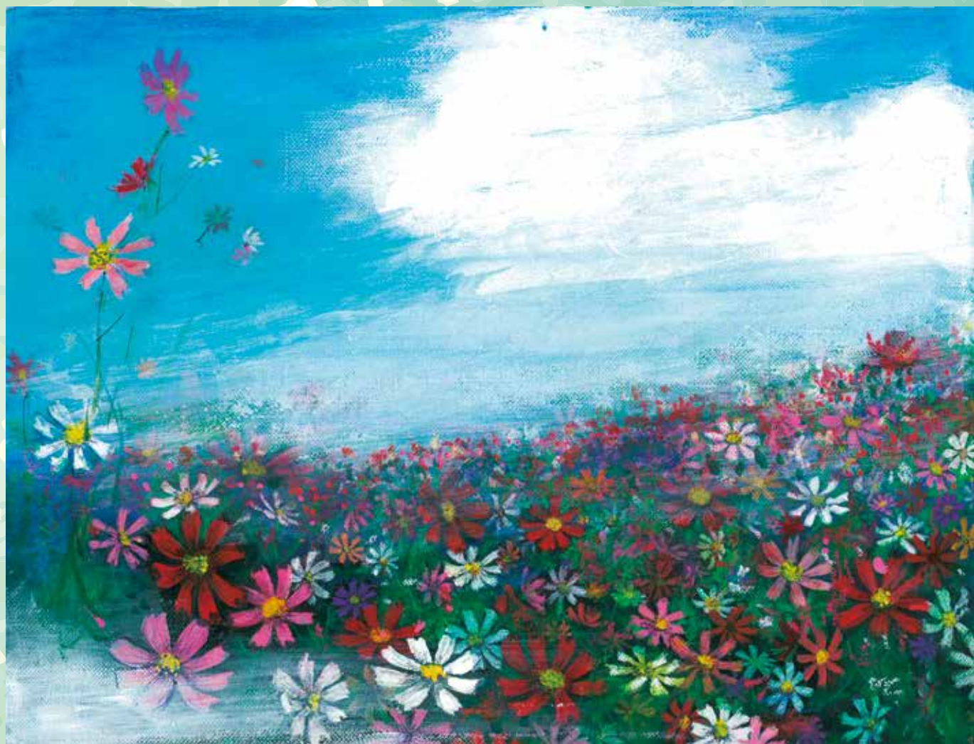
制作 徳永 紘志郎(本庄高等学校)