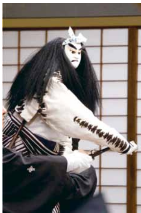
ひらかな盛衰記 逆櫓の段 ©青木信二

【夜の部】 一、 はなくらべしきのことぶき 花競四季寿 二、 せいすいき ひらかな盛衰記