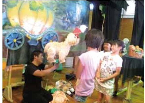
潟上小学校での公演の様子

初めて見る動き、ダンス、内容に興味津々で、食い入るように鑑賞していました。時折、笑い声も聞こえ、とても楽しんでいる様子でした。ダンスに参加する場面では最初は恥ずかしがっていた高学年生も、低学年生の無邪気さにつられて、楽しんでいました。