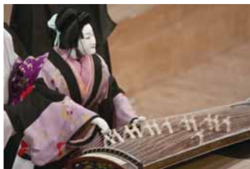
生写朝顔話 宿屋の段 ©青木信二