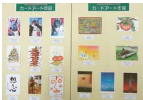
カードアート作品 (第35回教美展)