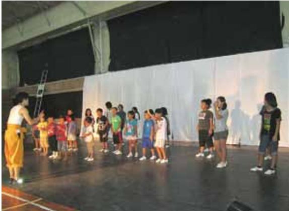
市木小学校での公演の様子