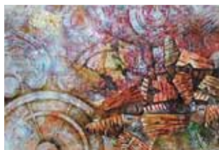
「はじまり」菊池 憲 国画会会友

期 間:10月16日(火)～10月28日(日) 場 所:ギャラリー蒼樹 延岡市北町1-3-7 ☎0982-35-3089 時 間:11:00～18:00 ※最終日は16:00まで 観 覧 料:無料 問い合わせ:日向高校 藤本恵三 出 品 者:岩村富美(日本美術院院長)後藤光雄(日本水彩画会)