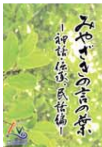
「みやざきの言の葉」

なお、県内外の希望者へも一人1冊無料でお配りします。(送料は自己負担) 先着1000名様への配布となりますので、希望される方は、9/9(日)付新聞の「県政けいじばん」をご覧ください。