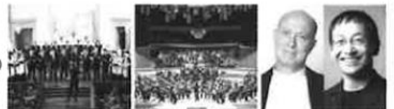
10/18日 スウェーデン放送合唱団 11/1日 ベルリン・ドイツ交響楽団 11/8日 歌劇「フィガロの結婚」(全4幕)

セット料金<全席指定> S席20,000円(18,000円) S席15,000円(13,500円) A席10,000円(9,000円)